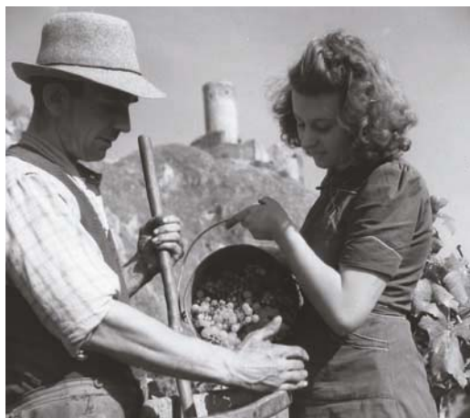
Couple aux vendanges à Martigny

Images disponibles sur www.museevalaisanduvain.ch