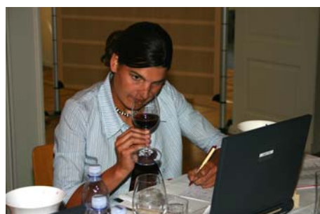
Vinea, concours mondial du Pinot noir , Sierre

Ici un livre de comptabilité pour les enfants de feu Capitaine du dizain Ambuel. Fonds Ambuel-R6, Archives de l'Etat du Valais