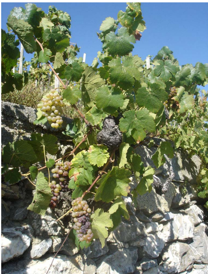
Un cépage unique au monde découvert à Savièse grâce à l'ADN.

Ces deux ceps accrochés à un mur de vigne à Savièse ne ressemblaient à rien de connu. Le généticien de l'université de Neuchâtel, le Dr José Vouillamoz a comparé leur profil ADN à celui de 2'000 cépages du monde, y compris tous ceux des Alpes. Rien. On peut l'affirmer avec certitude: un cépage unique a été découvert dans le vignoble de Savièse. Le test de paternité a permis de dévoiler une partie de son visage. Il pourrait être un descendant direct de la Rèze, autrefois utilisé notamment pour l'élevage du vin des Glaciers.