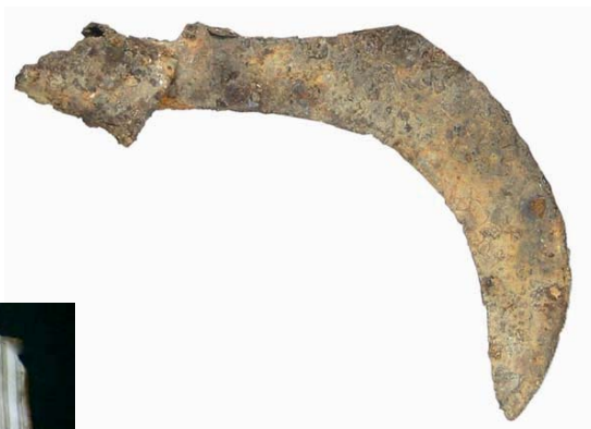
Serpette de Leukerbad (4 e siècle apr. J.-C.)