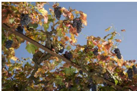
Treille de Cornalin à Ollon (VS).