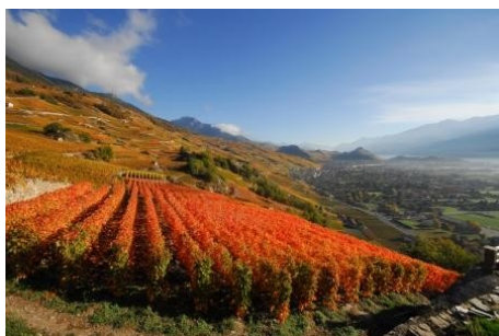
Paysage de vigne.