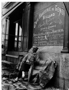
Devant le Café brasserie de Genève. Sion, 1890-1900. On distingue les noms de quelques-uns des vins vendus dans ce débit de boisson: Clos Molignon, Clos du Mont, Clos Grandinaz, Château la Soie.