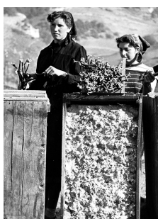
Pépinière près de Martigny, vers 1970.