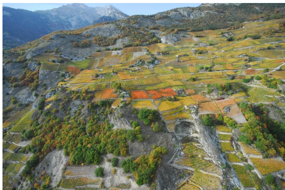
Paysage de vigne.