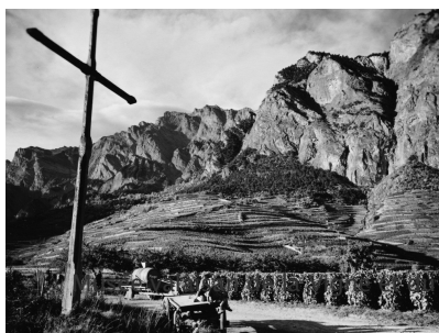
Chamoson, 1935-1940.