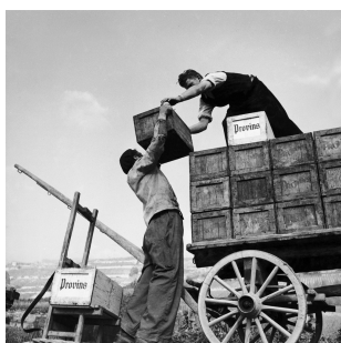
Vendanges à Ardon, vers 1947.

La coopérative Provins est la première à introduire l'usage de la caisse en bois, dès 1930.