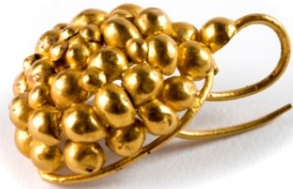
Boucle d'oreille en or, finement ouvragée, en forme de grappe de raisin, Massongex, thermes romains, 1er siècle. Musée d'histoire, Sion.